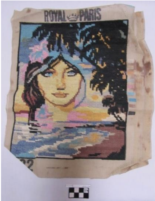
تصویر ۳: کوبلن (۳۰*۲۵)، اثر شهید بهرام سلیمانی.

جالب توجه است آثاری چون کوبلن دوزی‌ها با پرتره زن که برای شماره دوزی انتخاب می‌شده؛ به نوعی عشق و علاقه فردی رزمنده به خانواده را نشان می‌دهد؛ که در حواشی برخی از این آثار نوشته‌هایی با مضامین دینی و عناوین مناطق جنگی نیز آمده است. برای نگارنده موضوع جالب توجه این بود که اثرهای این‌چنینی چون تصویر شماره ۳ با توجه به لکه‌های خونی که در آن قابل مشاهده است؛ بیانگر این نکته است که رزمنده در زمان و مکان جنگ در فرصت‌های استراحت خود در سنگر به این هنر می‌پرداخته است.