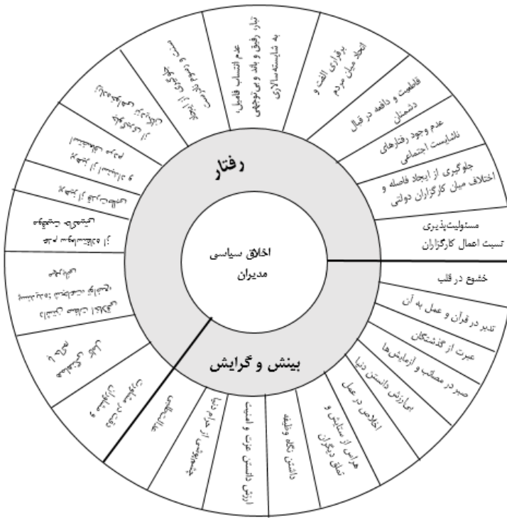
شکل ۴. الگوی مفهومی اخلاق سیاسی مدیران مبتنی بر نهج البلاغه