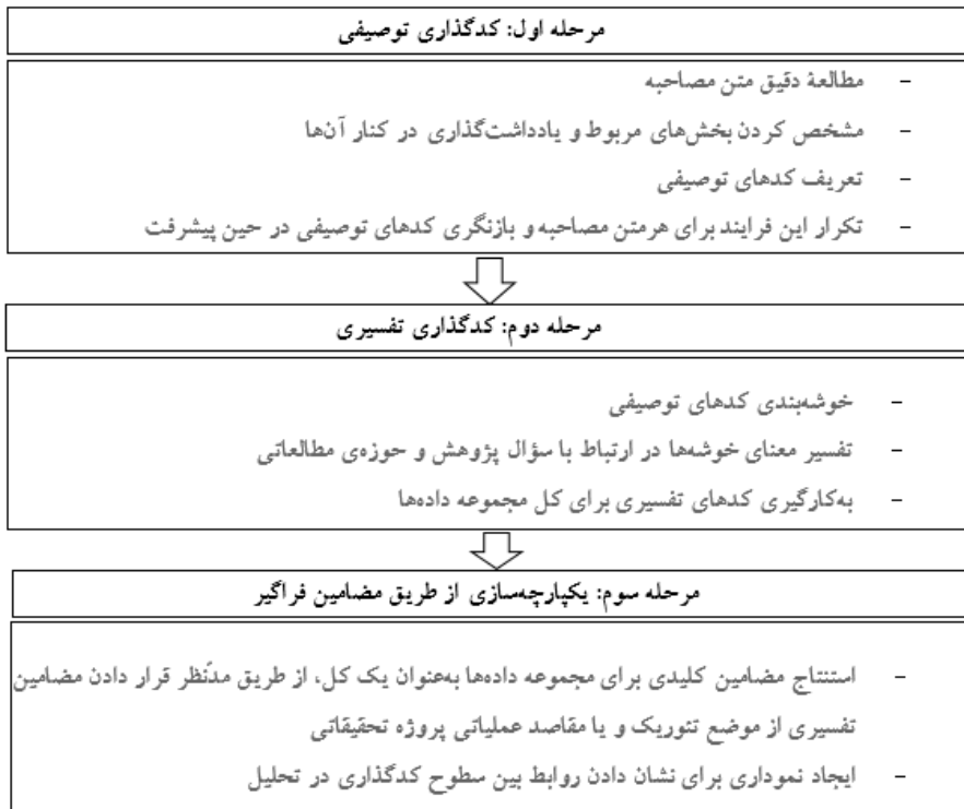
شکل ۲. فرایند تحلیل مضمونی

کینگ و هاروکز ۱ در سال ۲۰۱۰ با بررسی و جمع‌بندی تلاش‌های دیگر پژوهشگران تحلیل مضمون، فرآیندی سه مرحله‌ای را برای تحلیل مضمون ارائه داده‌اند که در این تحقیق نیز از این فرآیند استفاده می‌شود. این فرآیند شامل سه مرحله کدگذاری توصیفی ۲ ، کدگذاری تفسیری ۳ و یکپارچه‌سازی از طریق مضامین فراگیر ۴ است.